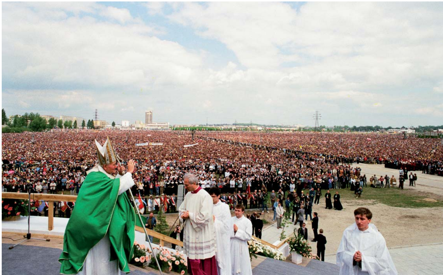
Jan Paweł II w Rzeszowie, 2 czerwca 1991 r.

Uśmiechnięta Jubilatka – setne urodziny parafianki z Sobniowa