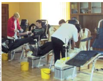
Akcja honorowego oddawania krwi

Oddając własną krew, dobrowolnie i bezinteresownie, to gest o wysokiej wartości moralnej i obywatelskiej. To Dar Życia... Niech dawcy krwi, którym należy się wdzięczność wszystkich, będą coraz liczniejsi we wszystkich częściach świata.” (Bł. Jan Paweł II, Światowy Dzień Krwiodawców, 2004).