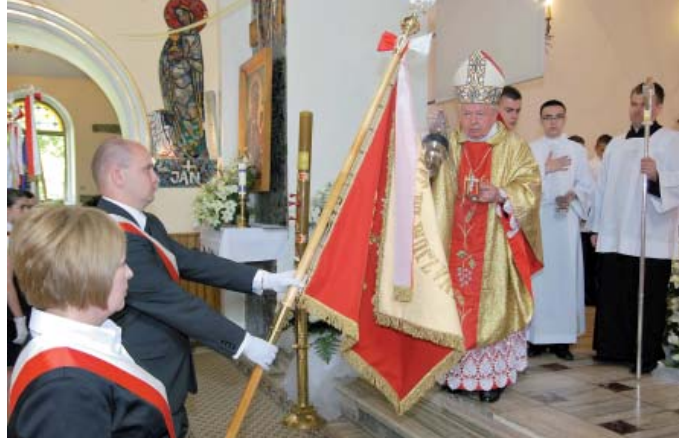
Poświęcenie sztandaru przez bp. Kazimierza Górnego