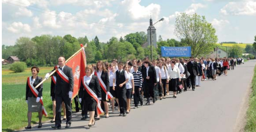
Przemarsz do Gimnazjum im. Jana Pawła II w Iwierzycach