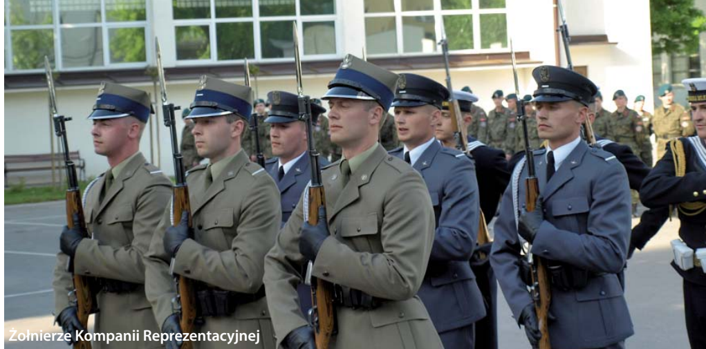
Żołnierze Kompanii Reprezentacyjnej