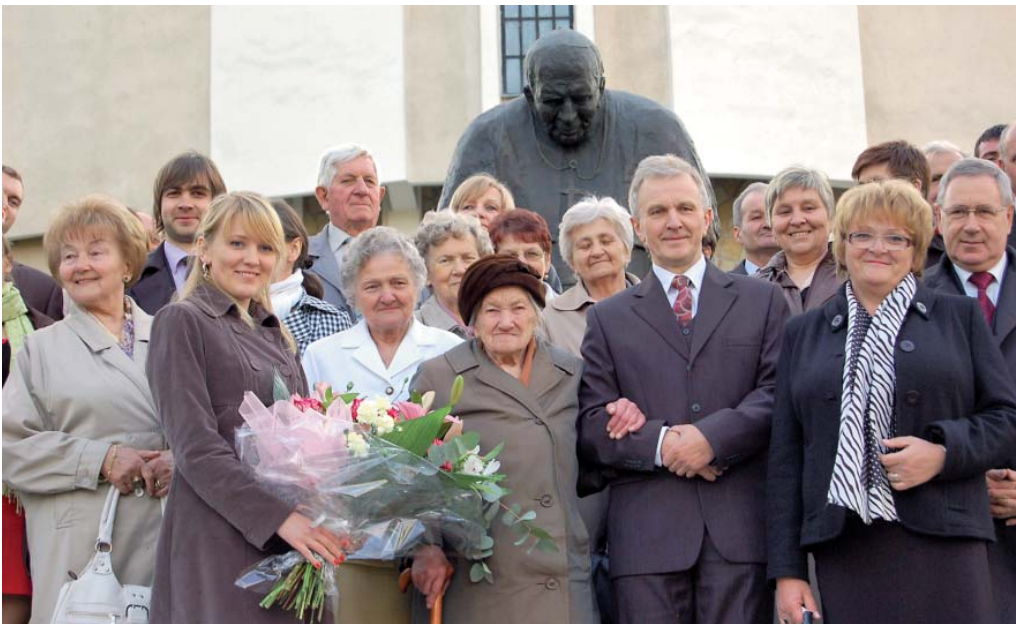
Jubilatka z rodziną przed kościołem