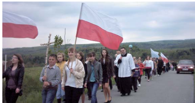
Na pielgrzymim szlaku do „małej Jasnej Góry”